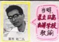
当時、 日高 の御坊中学校教諭

御坊は花々に包まれた街です。 温暖な気候 と、長い 日照時間 に恵まれているため、御坊が全国有数の花の産地となっているのです。このような環境を生かした生産を『 花き栽培 』と呼びます。