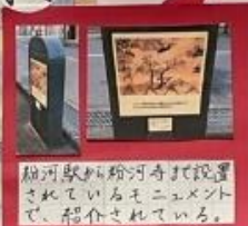
粉河駅から粉河寺まで設置されているモニターで、紹介されている。