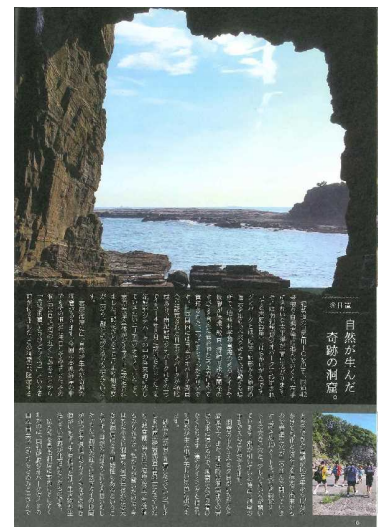
作品の一部を抜粋して掲載しています。