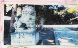
小竹八幡神社 親子狼犬 昭和8年皇太子殿下 下ご生誕記念の 親子狼犬 小竹八幡神社 のわかつたこと

小竹八幡神社にある狼犬は全部で 6つ8体ほどいます。その狼犬たち は耳や口や体けいがかみんちうかうこと かわかった。 とてもおもしろかったです。