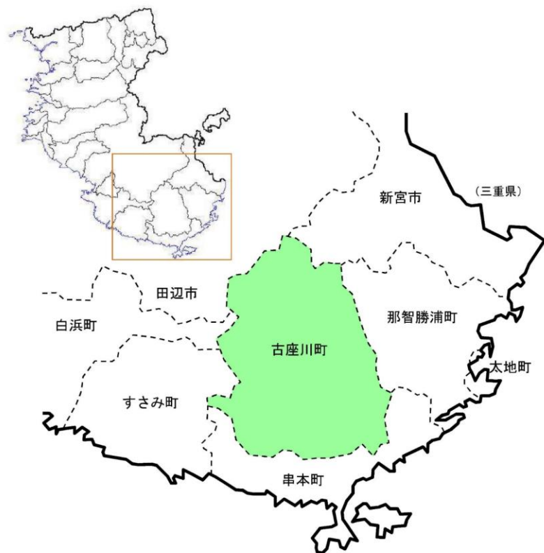
古座川町の位置図

町域は東西 19.5 km・南北 21.7 kmに及び、総面積 294.23 km 2 である。