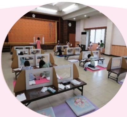
生馬公民館寺子屋塾 （上富田町）