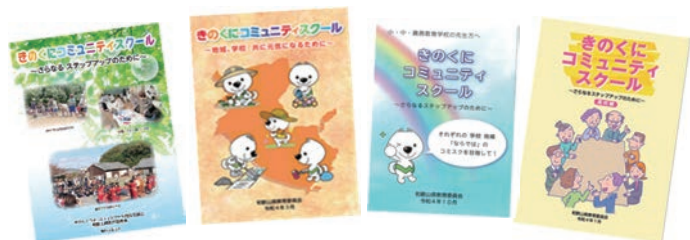
「きのくにコミュニティ スクール」リーフレット

きのくにコミュニティスクールの取組を、リーフレットや教育広報紙、テレビ・ラジオ等を通じて広報しています。また、県教育委員会のホームページを通じて、各市町村や県立学校の取組、研修会等の情報を発信しています。