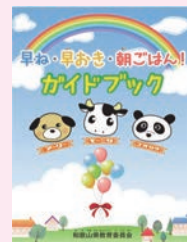
早ね・早おき・朝ごはん！ ガイドブック

ガイドブック等を活用し、保護者やこどもたちに基本的な生活習慣の大切さの理解を促進するとともに、専門講座等を通し、参加者同士が学び合う場を設けています。