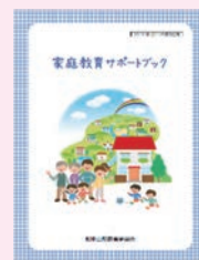
家庭教育サポートブック