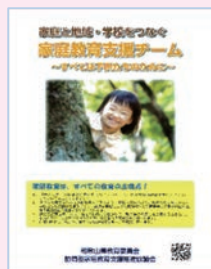
家庭教育支援推進 リーフレット

保護者が抱える子育ての悩みや不安を解消するため、個別訪問等を行う家庭教育支援チームの養成を推進しています。