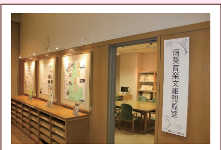
南葵音楽文庫 閲覧室（県立図書館内）

和歌山県では、公益財団法人読売日本交響楽団から「南葵音楽文庫」（徳川頼貞（1892～1954）によって収集された楽譜、音楽書、音楽関係雑誌のコレクション約 20,000 点）の寄託を受け、調査・研究、公開、普及を通じて音楽文化に親しむ機会の充実を図ります。