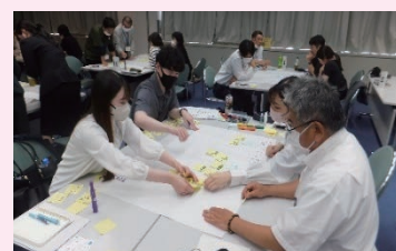
市町村社会教育関係職員等研修

市町村の社会教育に携わる職員を対象に資質向上のための研修を行います。市町村間の連携や情報交換を進め、社会教育の諸課題についての共通理解やネットワークの強化に取り組んでいます。