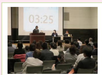
ビブリオバトル（令和5年度）