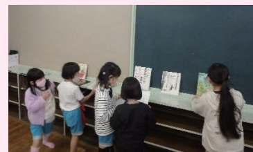
学童保育所への配本（那智勝浦町）