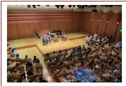
メディア・アート・ホール