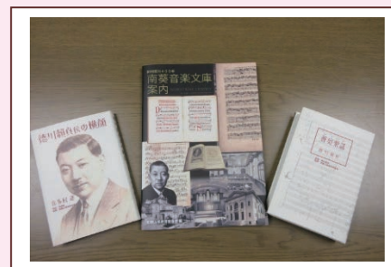
紀州徳川 400 年記念出版南葵音楽文庫関連書籍