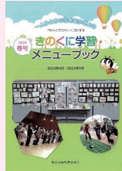
きのくに学習メニューブック

「きのくに学習メニューブック」やホームページを通じて、県や市町村、大学、生涯学習関連団体等の講座情報を広く県民に提供し、人々の生涯にわたる学習活動を支援しています。また、受講者には、受講講座に応じて単位の認定を行い、一定以上の単位取得者に認定証を授与するなど、学習活動を奨励しています。