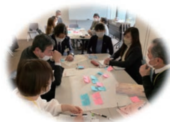
きのくにコミュニティスクール 座談会

学校運営協議会と地域学校協働活動の一体的推進、教職員への推進、学校運営協議会の活性化、学校と地域をつなぐ役割を担うコーディネーターの発掘・育成、行政の伴走支援等について、専門性を有する4名の CS マイスターがきのくにコミュニティスクールを充実させるための助言やサポートを行います。