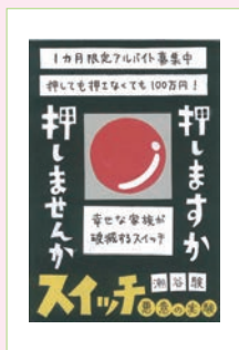
POPコンクール最優秀受賞作品 （高校生の部）