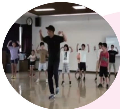
中央公民館における ダンス教室（美浜町）

こどもの豊かな育ちを支えるためには、学校・家庭・地域が相互に信頼関係を築きながら、それぞれの役割を果たしていく必要があります。そのためにも、学校の空き教室や公民館等を活用し、地域の人々の協力を得ながら、様々な体験活動や学習支援等を行う「放課後等こども教室」や「こどもの居場所づくり」の開設を推進しています。また、地域の人と人とのつながりを深め、こどもたちが地域に愛着をもち、地域の良さに気づく活動や体験の場を積極的に提供し、こどもの豊かな育ちや学びを支えるとともに、関わる大人同士の学びや新たなつながりが生まれています。