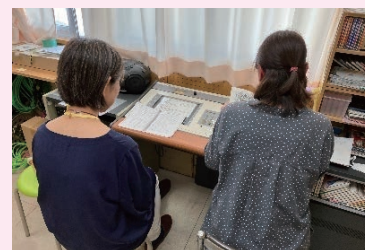
朗読放送（かつらぎ町）

さらに、県と連携し、国の「読書活動推進事業」を受託している町では、給食の時間を利用して朗読を放送する取組や、学童保育所への配本を通して読書活動支援とコミュニケーションを図る取組等を実施しています。