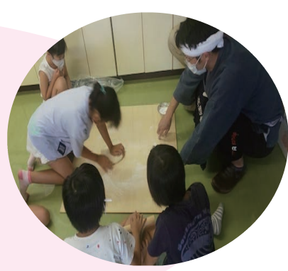
太地町公民館における うどん作り（太地町）