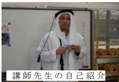
講師先生の自己紹介