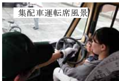
集配車運転席風景