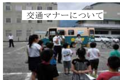
交通マナーについて