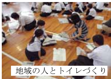
地域の人とトイレづくり