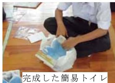
完成した簡易トイレ