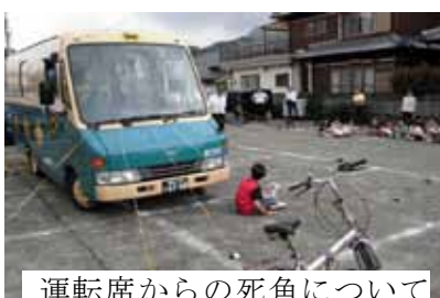
運転席からの死角について