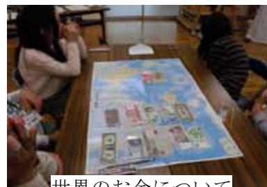
世界のお金について