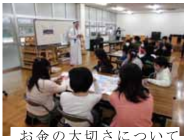
お金の大切さについて