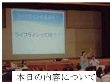
本日の内容について