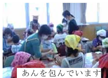
あんを包んでいます