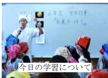
今日の学習について