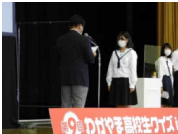
優勝 田辺高校 A