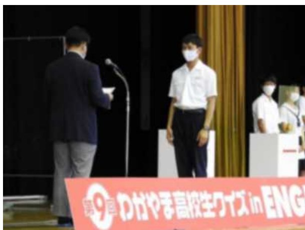
3位 近畿大学附属和歌山高校 G