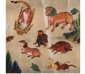
くまのこんげんえんごえまき 熊野権現縁起絵巻(県立博物館蔵)

企画展 | きのくにの物語絵 期 3月13日(土)～4月18日(日) 和歌山県には、寺社の成り立ちなどの物語を美しい絵で語る絵巻物が数多く残されています。きのくにの「絵解き文化」に注目しながら、さまざまな物語絵の作品を紹介します。