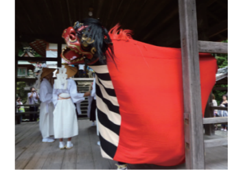
ひろはちまん でんがく 「広八幡の田楽」の獅子(広川町)

春期企画展 | 紀州の獅子と獅子頭 期 3月20日(土)～5月9日(日) 紀州の人々に長いあいだ親しまれる獅子舞について、県内各地の獅子頭など資料を集め、その特色や和歌山の祭の歴史を紹介します。