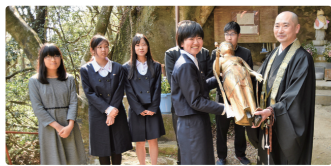
お身代わり仏像の奉納の様子

和歌山県立博物館が、県立和歌山工業高等学校・和歌山大学と連携して取り組んでいる、3Dプリンター製文化財レプリカを活用した文化財の防犯・防災対策事業（「高校生・大学生と創る「お身代わり仏像」Project～未来に伝える 和歌山の文化財～」）が、第8回プラチナ大賞（プラチナ構想ネットワーク他主催）にて優秀賞・きらり活動賞を受賞しました。 少子高齢化や過疎化という地域社会が抱える課題に対して、地域の未来を担う生徒や学生とともに実効性のある取組を行っていることが評価されました。