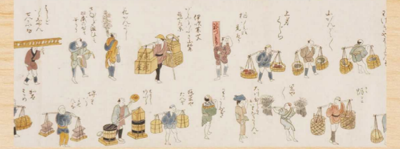
天保年代物売図(和歌山県立図書館蔵) 城下町和歌山で活躍した商人が描かれています。

江戸時代には日本有数の人口を誇った城下町和歌山。城下町和歌山の歴史を語る文化財から、当時を生きた人々の生活や文化を紹介いたします。