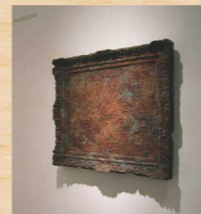
柴川敏之「2000年後に発掘された絵画の化石」

今回展示の作品の中には、過ぎ去った昔や想像された未来が留められています。時間の旅へ出かけましょう。