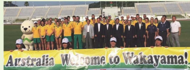
和歌山県教育委員会 スポーツ課