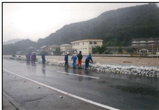
【①平成13年8月 望見橋下流】