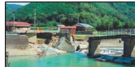
【④平成23年9月 沼田谷橋】