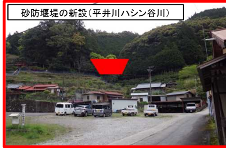
砂防堰堤の新設(平井川ハシン谷川)