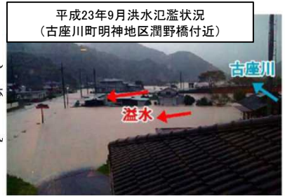
平成23年9月洪水氾濫状況 (古座川町明神地区潤野橋付近)