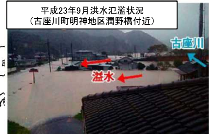
平成23年9月洪水氾濫状況 (古座川町明神地区潤野橋付近)