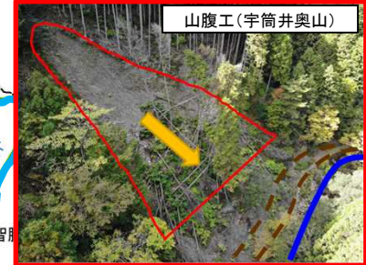
宇筒井奥山治山事業