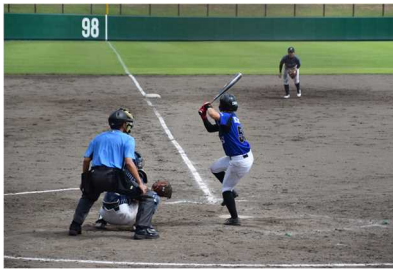
全日本大学女子硬式野球選手権大会