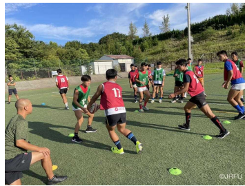
ラグビーU19日本代表合宿