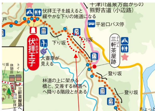
道普請 実施予定場所