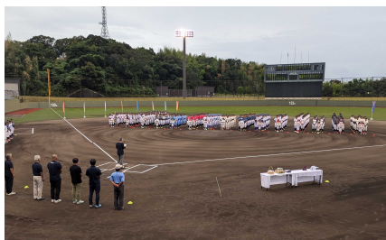
全日本大学女子硬式野球選手権大会