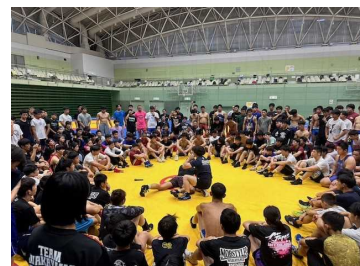
レスリング強化試合