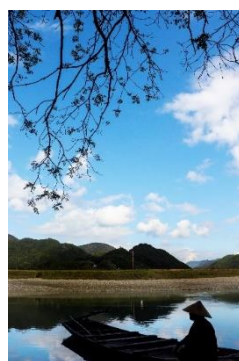
大辺路 (安居の渡し)