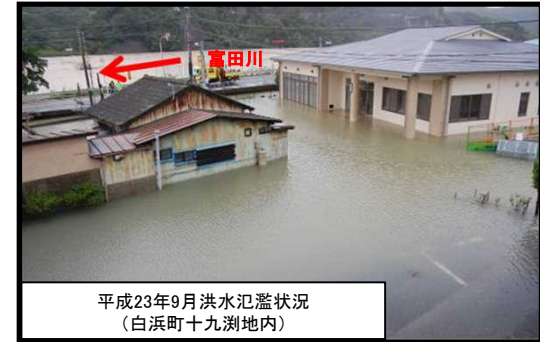
平成23年9月洪水氾濫状況 (白浜町十九洲地内)