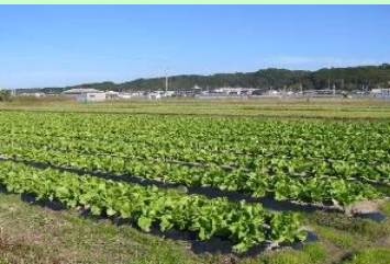
(レタスの栽培風景)

冬期の温暖な条件を活かして露地野菜が多く栽培されています。主な品目として、トンネル栽培が中心の1~3月採りのレタス、主に漬け物に用いられるダイコン、季節の食材として市場や消費者からの評価が高いウスイエンドウ、特産の梅干しに不可欠なシソ、夏秋どりナスなどがあります。また、施設では、品質にこだわったイチゴ、ミニトマト、キュウリなどの栽培が中心となっています。