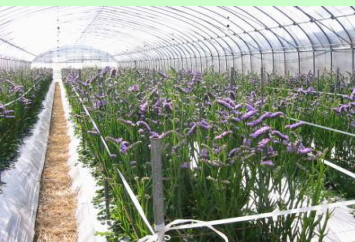
(スターチスの栽培風景)

施設ではスターチス、宿根カスミソウ、ガーベラ、トルコギキョウの栽培が盛んに行われており、高い市場評価を得ています。また、露地ではストック、葉ボタン、小菊などが栽培されています。冠婚葬祭など様々な消費者ニーズや用途に対応できるように、産地全体として栽培する品種・品目にこだわり、高品質・安定出荷に努めています。