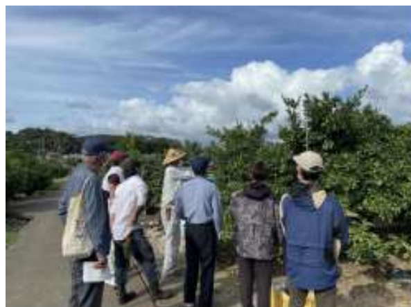
塚本氏による着果状況の説明