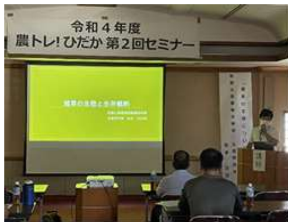
雑草に関する講演（松本主査研究員）