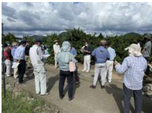
集合する参加者（日高川町若野）

今回は、来年2月頃、作業のポイントとなるせん定研修会を計画しており、若手農業者等へ匠の技術が伝承されるよう取り組んでいく。