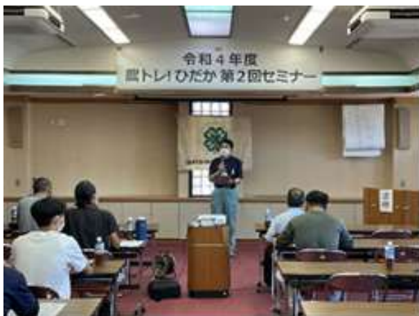
開会あいさつ（初山副部長）