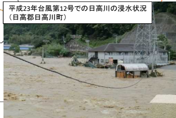
平成23年台風第12号での日高川の浸水状況(日高郡日高川町)