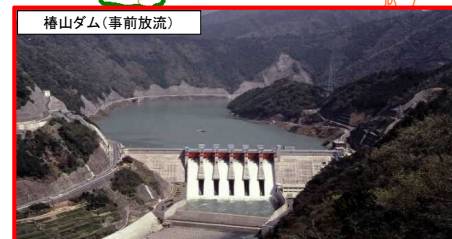
椿山ダム(事前放流)