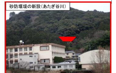
砂防堰堤の新設(あたぎ谷川)