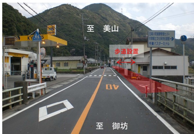
高津尾橋からの現況