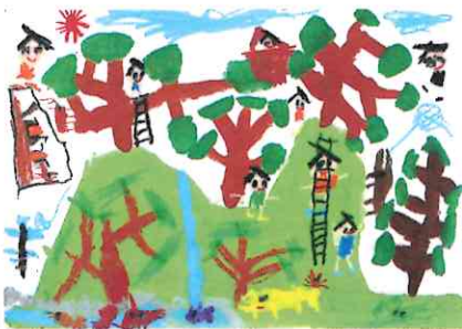
「山でいっぱい遊んだよ」