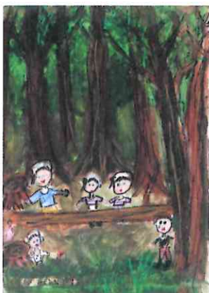
「間ばつ体験で木を切った」