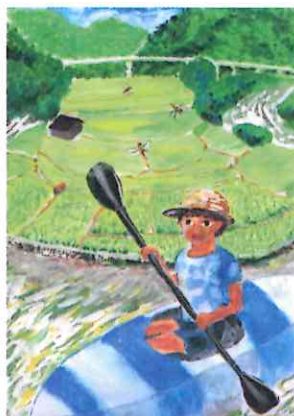
「あらぎ島でカヌー」