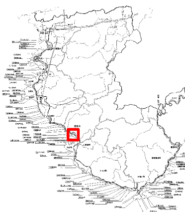
凡例(事業実施年度)