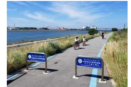
川のサイクリングロード（自転車歩行者専用道路）