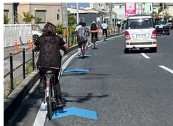
通行位置を明確にした道路