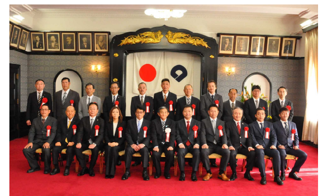
平成31年2月5日 和歌山県優良工事表彰式