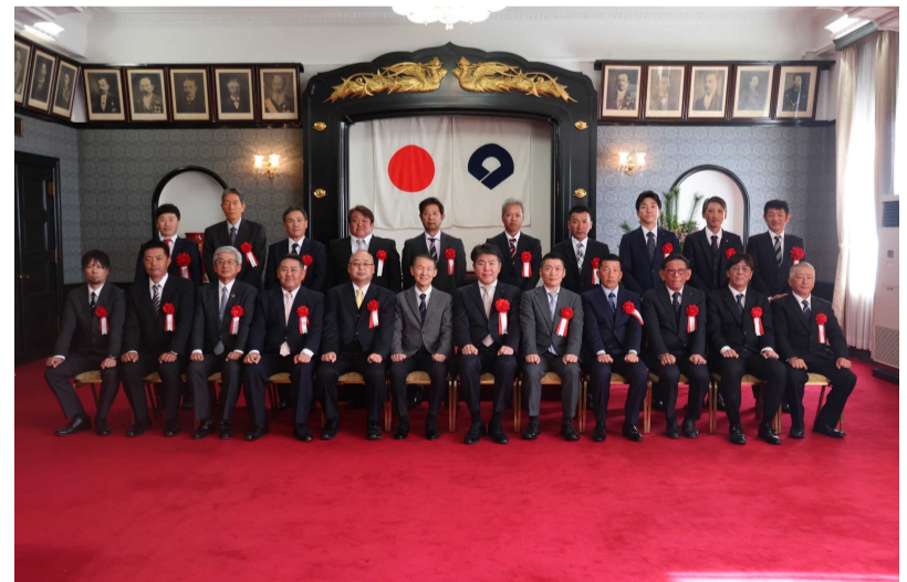
令和7年1月21日 和歌山県優良工事表彰式