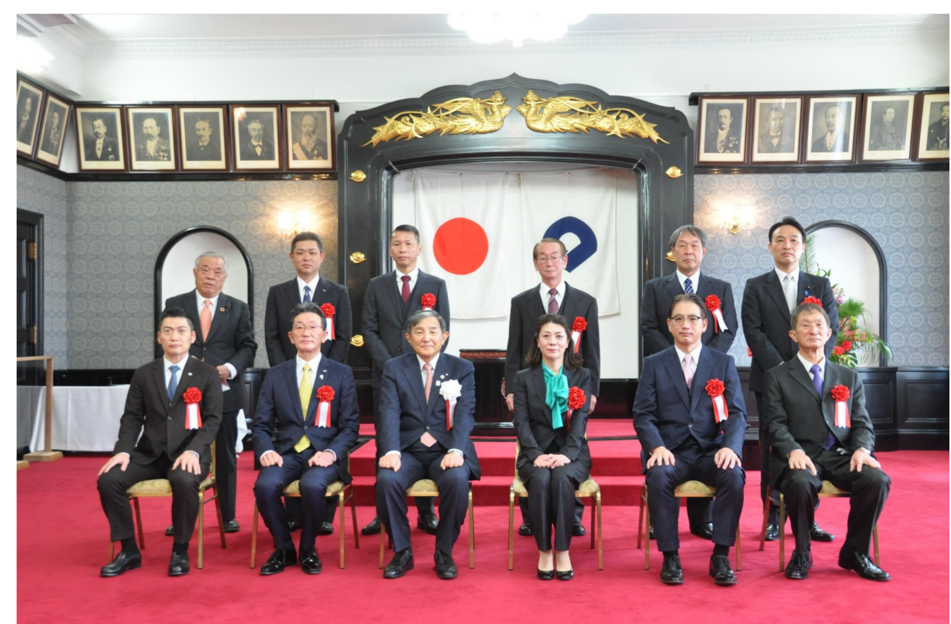
令和4年2月14日 和歌山県優良工事表彰式