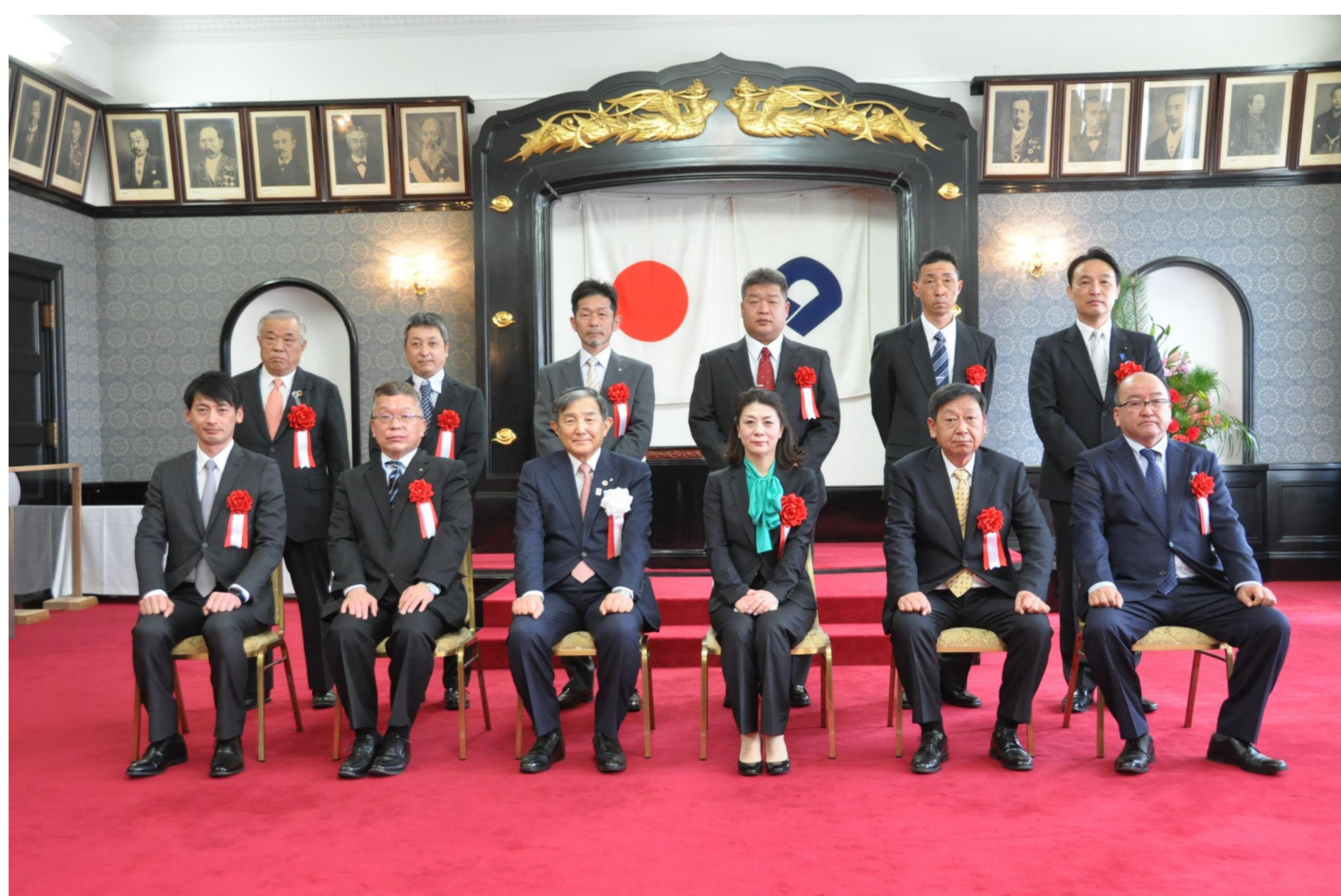
令和4年2月14日 和歌山県優良工事表彰式