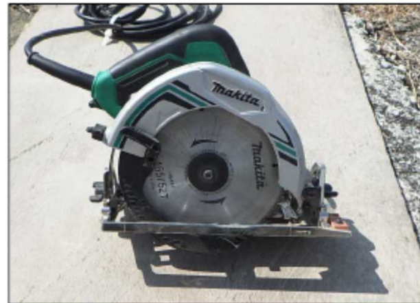
使用機器: 携帯用丸のこ盤(丸のこ)