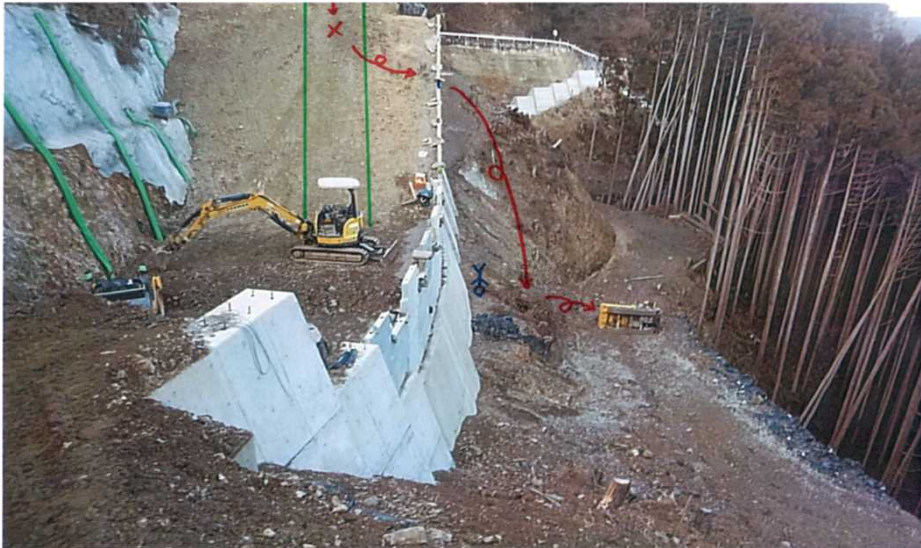
添付資料①：事故現場写真