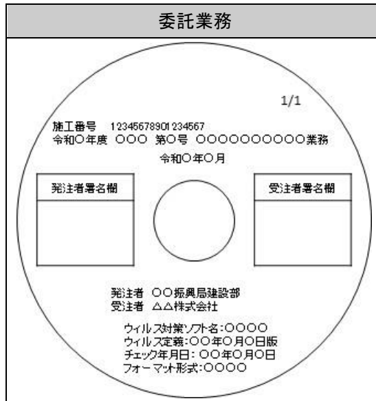
図3 CD-R又はDVD-Rのラベルイメージ