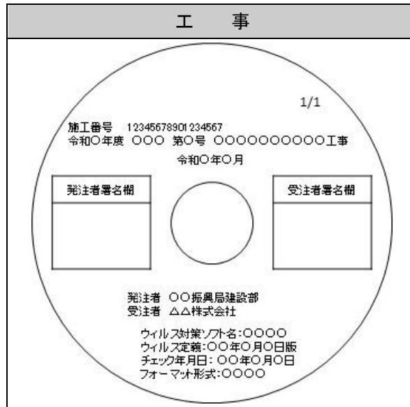
図5 CD-R又はDVD-Rのラベルイメージ