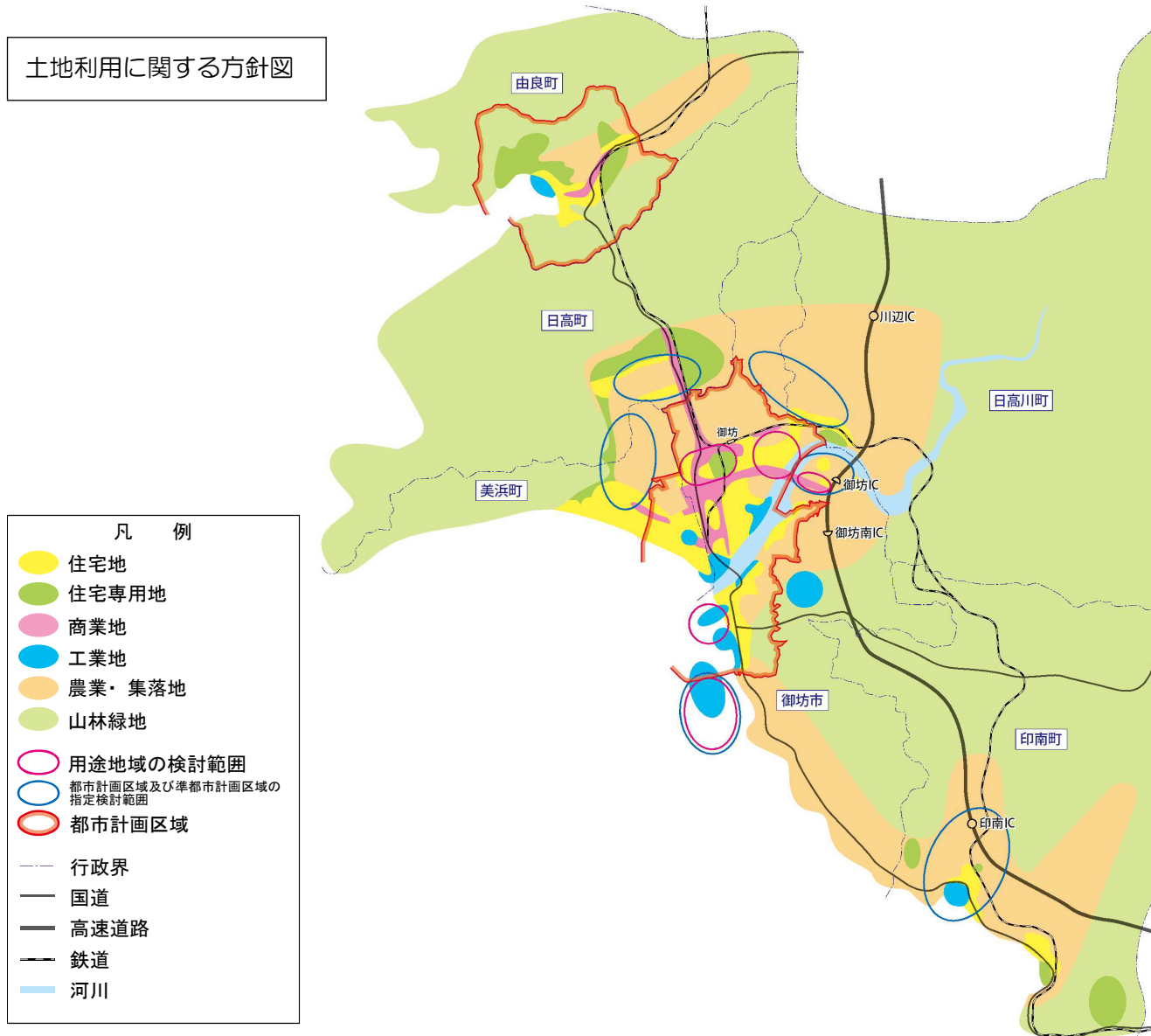
土地利用に関する方針図