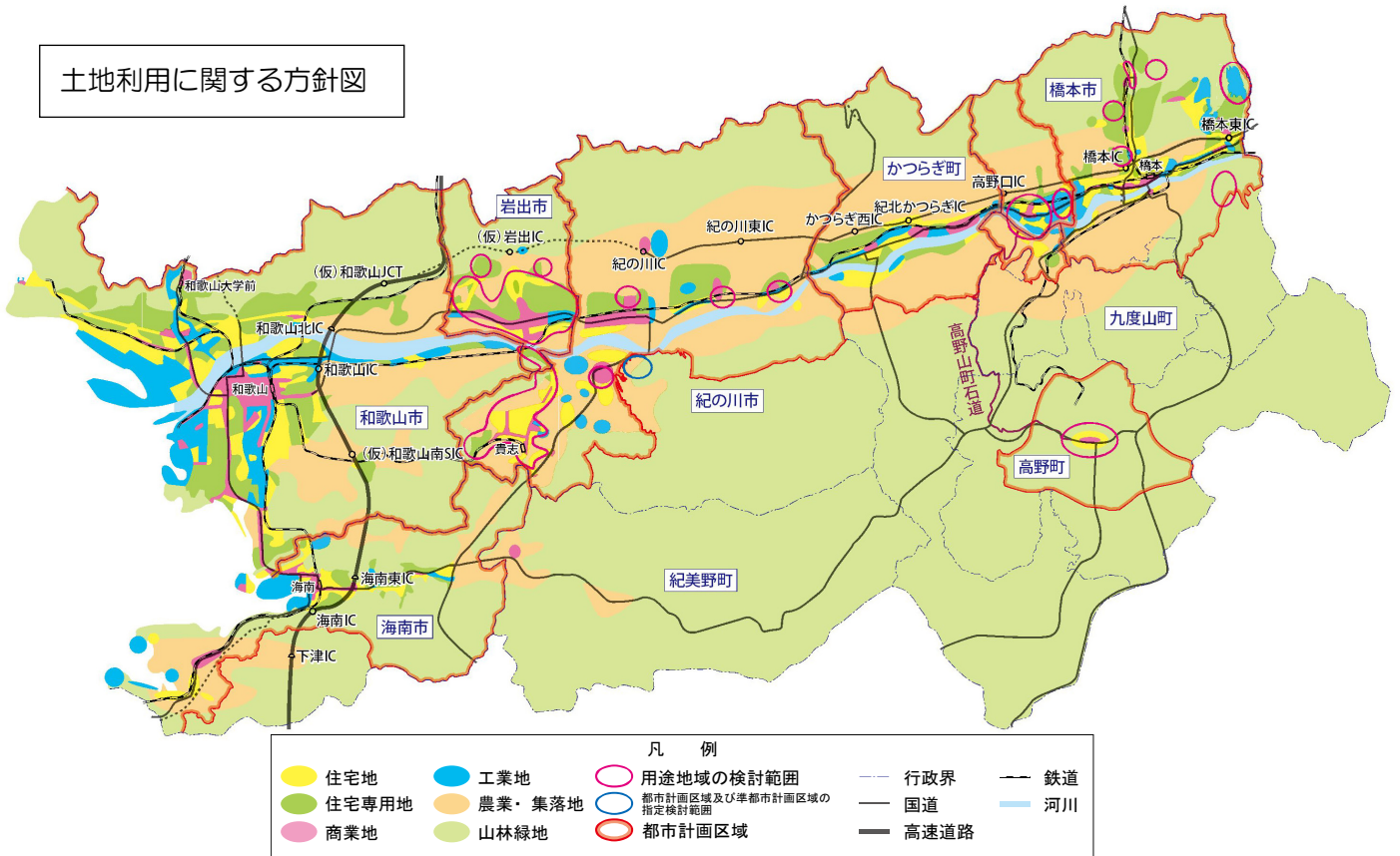
土地利用に関する方針図