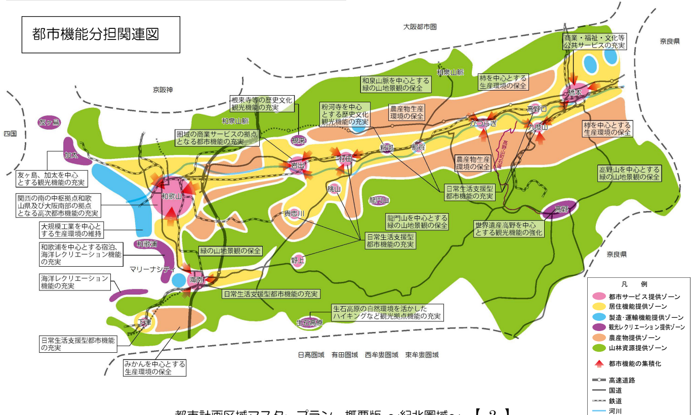
都市機能分担関連図