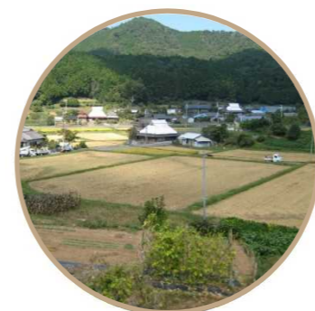
暮らしの営みによってつくられた集落