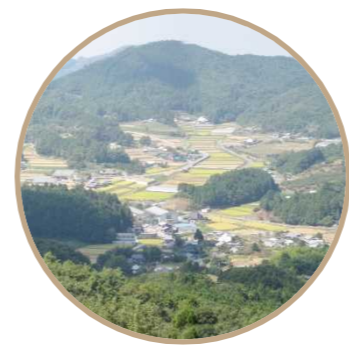
文化的景観としての価値を持つ高野参詣道(町石道)からの眺望