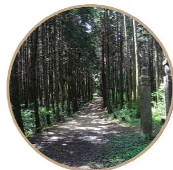
文化財的価値を持つ高野参詣道(町石道)