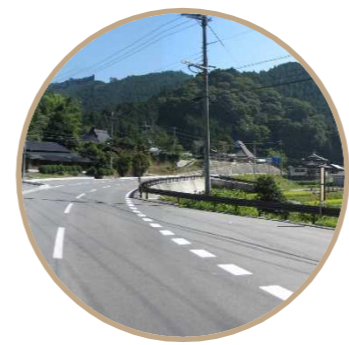
高野山へといざなうアクセスルート世界遺産を結ぶ歩行者動線の沿道景観