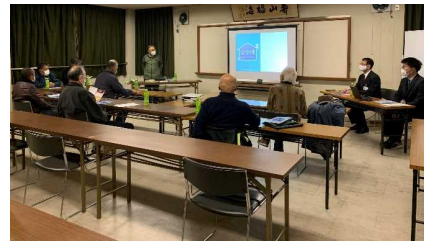
和歌山市内での 開催風景

協議会事務局（県建築住宅課）から 各市町村空き家対策担当部局あてに 依頼文及び自治会向けの案内文を発出予定