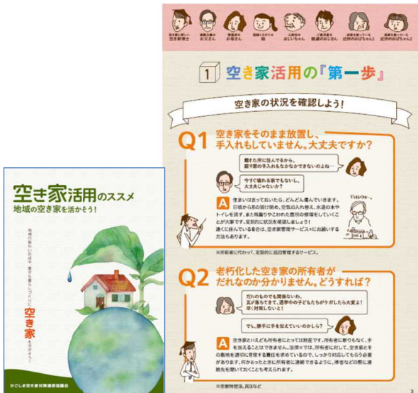
かごしま空家対策推進協議会