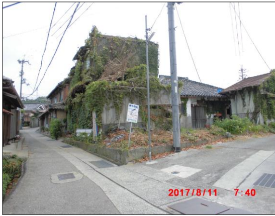
代執行開始前(平成29年 8月11日)