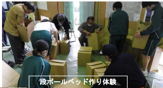
段ボールベッド作り体験