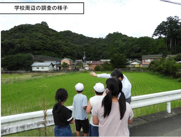
学校周辺の調査の様子