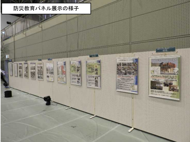
防災教育パネル展示の様子