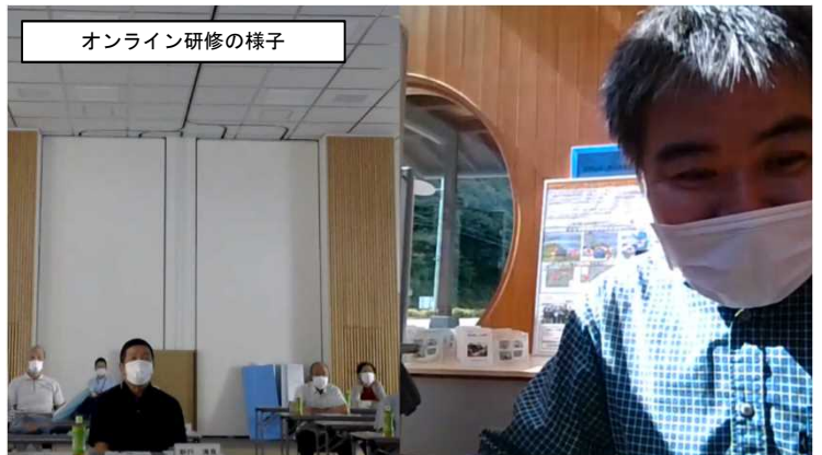
オンライン研修の様子

9月30日に日高川町民生児童委員協議会川辺地区を対象に土砂災害についての防災研修をオンラインで実施しました。