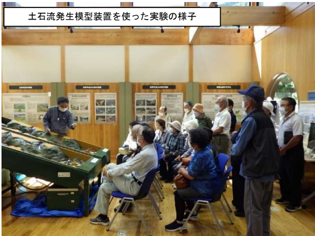
土石流発生模型装置を使った実験の様子