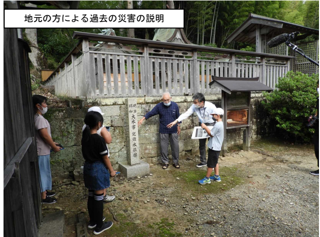
地元の方による過去の災害の説明