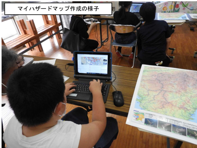
マイハザードマップ作成の様子