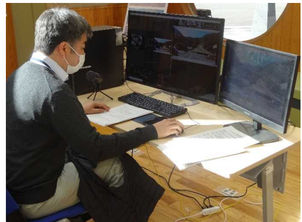
オンライン交流会の様子

土砂災害啓発センターでは、土砂災害に関する研修を受け入れています。研修をご希望の方は、希望日の一か月前までに、電話またはメールにて事前にご連絡ください。また、研修内容の相談にも応じています。なお、研修室の使用状況等によりご希望に沿えない場合がありますので、あらかじめご承知ください。