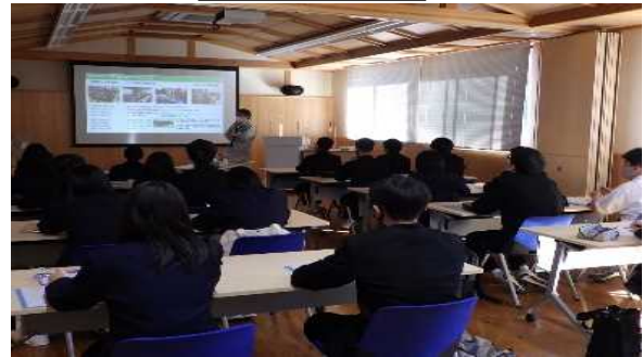
砂防えん堤の効果の説明