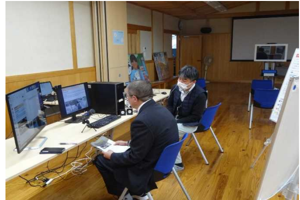
オンライン研修の様子

15日にオンラインで行われた四川省防災セミナーに参加し土砂災害に関する防災研修を行いました。