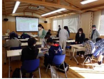
砂防えん堤の説明