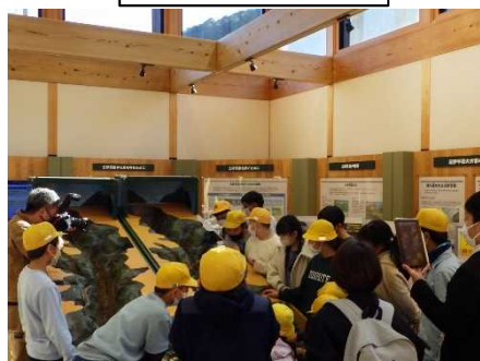
砂防えん堤の効果の説明