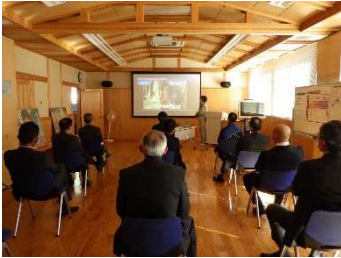
スライドによる研修