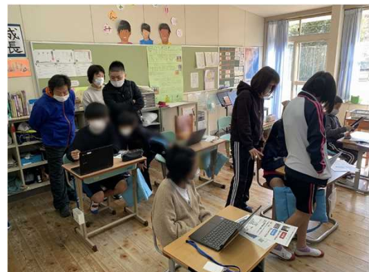
Webハザードマップで自宅周辺の様子を確認している児童