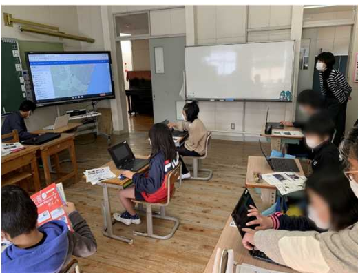
電子黒板でWebハザードマップの操作方法を説明。