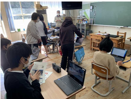
配布したWebハザードマップのQRコードを用いて、児童がハザードマップにアクセス。