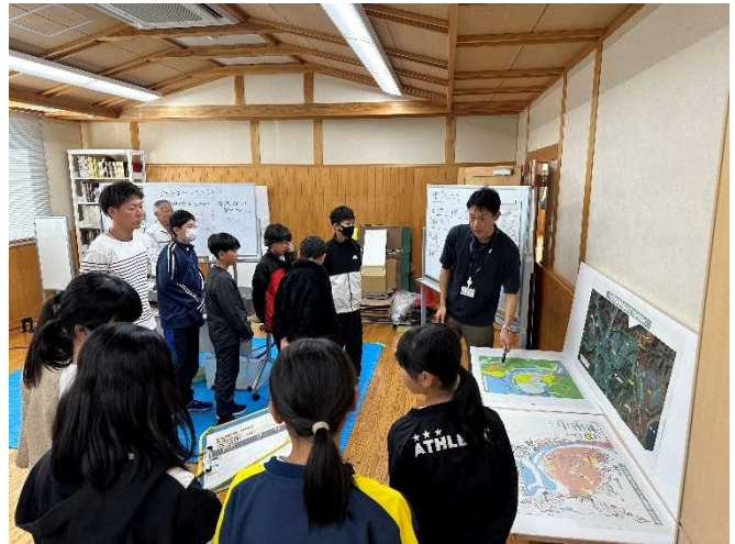
防災マップについて学習する様子