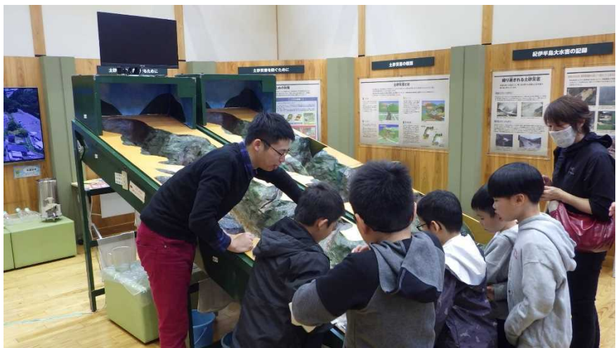
↑ 土石流の擁壁実験の様子