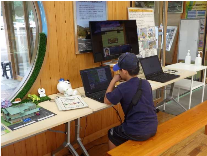
防災RPGを操作する様子