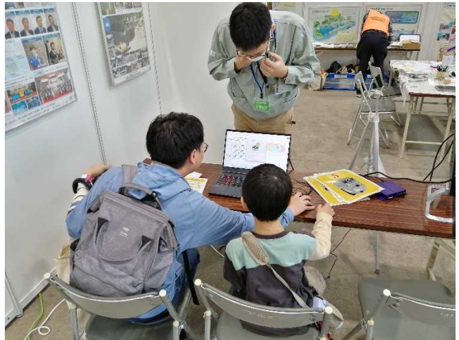
防災すごろくを体験する様子