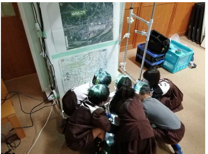
AR砂場にて学習する様子