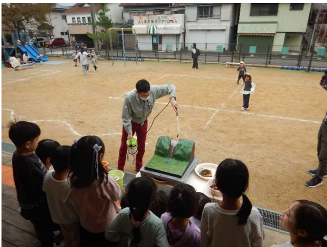
土砂が流れる実験の様子