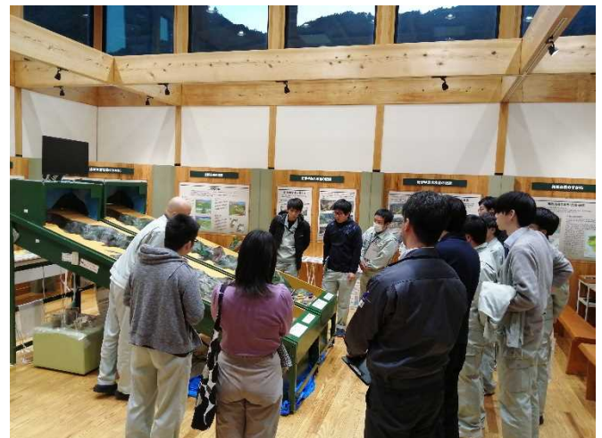
土石流擁壁実験の様子