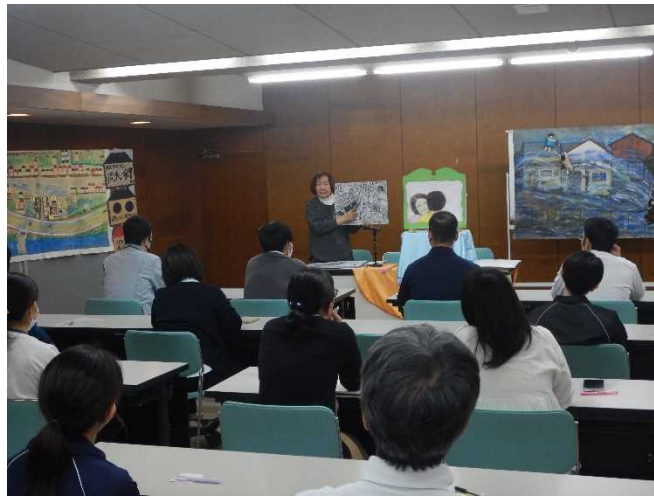
語り部による紙芝居の様子