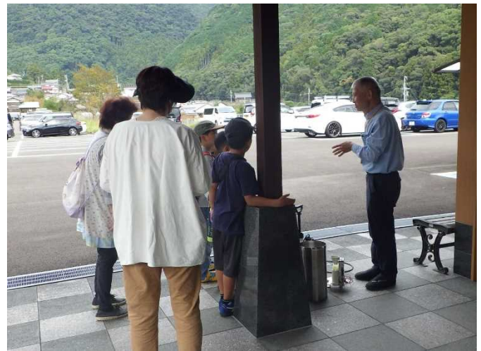
砂防堰堤見学の様子