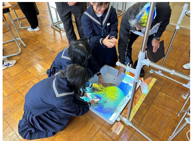
AR砂場にて学習の様子