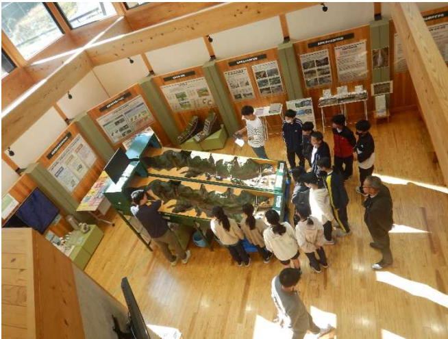
土石流の擁壁実験の様子