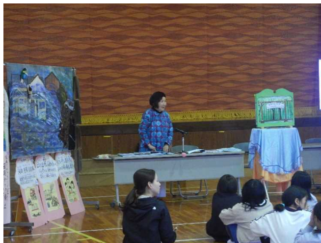
語り部による紙芝居の様子