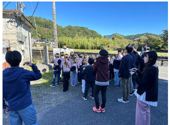
危険箇所を確認する様子