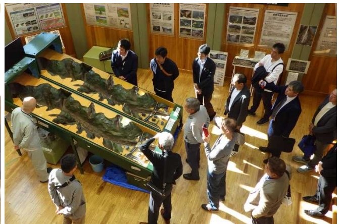
土石流擁壁実験の様子