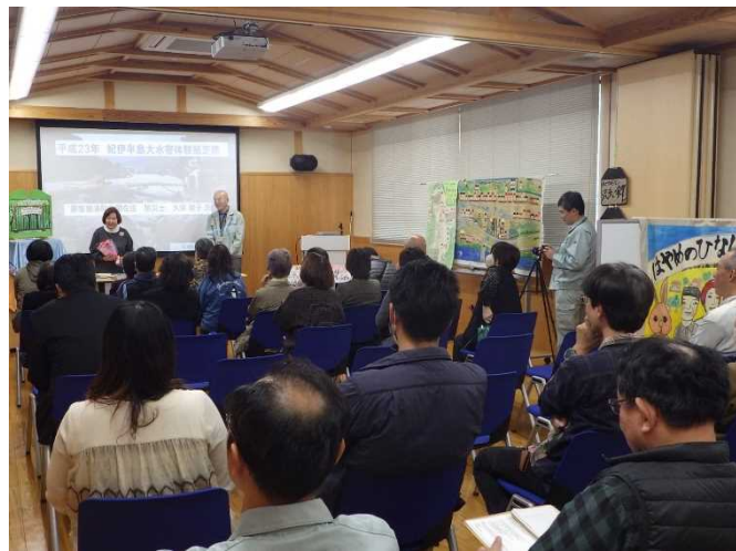
語り部による紙芝居の様子