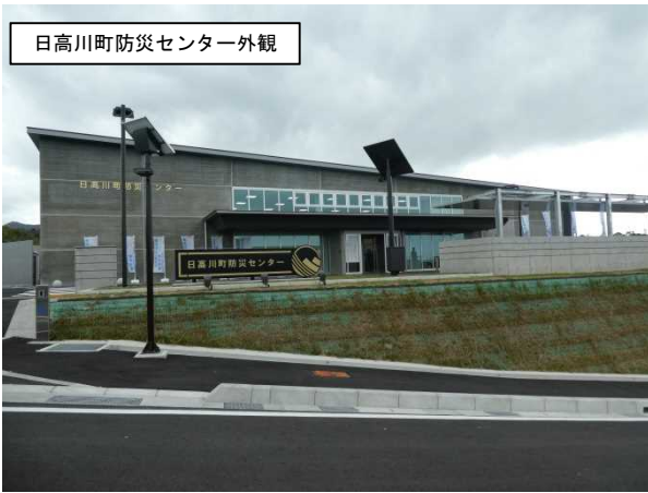
日高川町防災センター外観