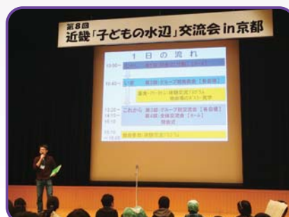
第8回 近畿「子どもの水辺」交流会 in 京都

その後、今日1日一緒に過ごすお兄さん、お姉さんの案内で各グループ別発表会の会場に向かいました。