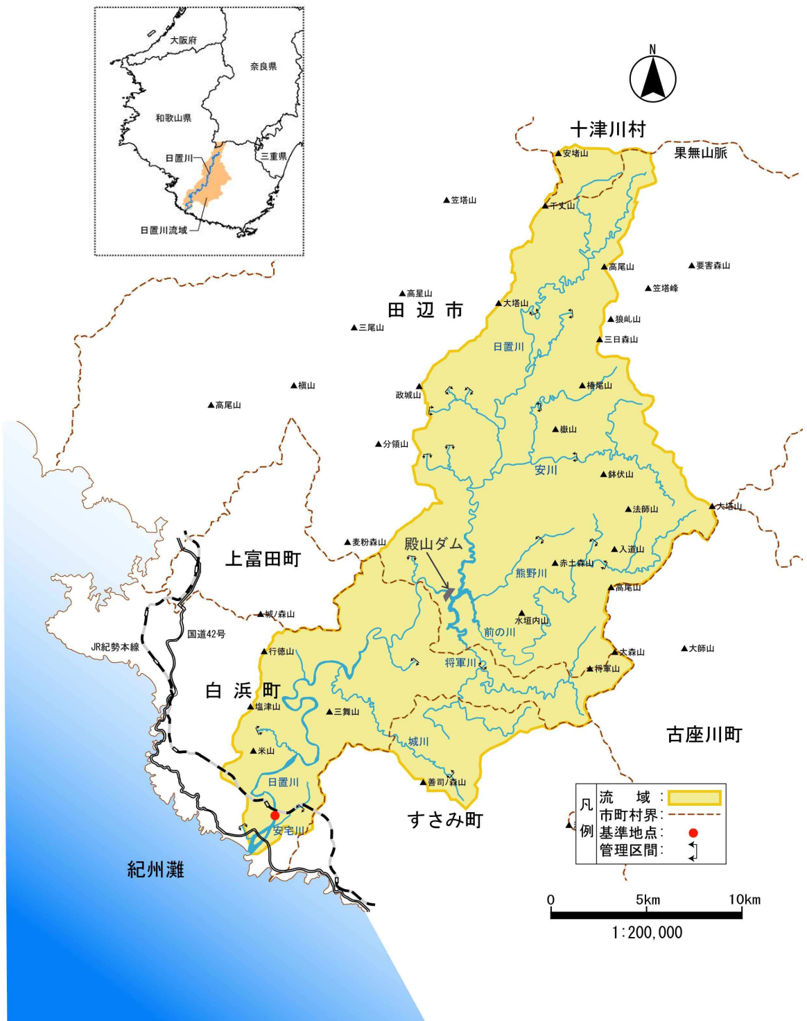
(参考図) 日置川流域概要図