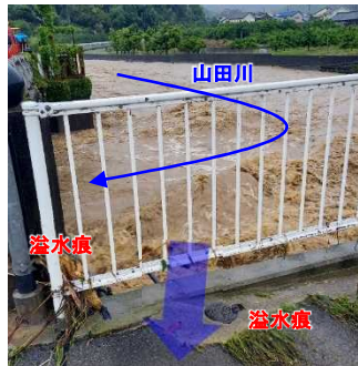
②令和5年6月豪雨 (湯浅町一之橋付近)