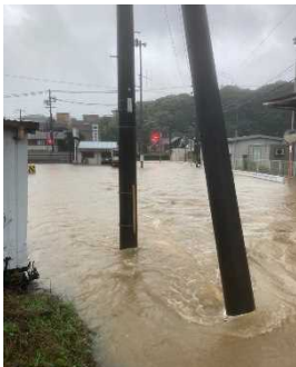
①令和5年6月豪雨 (湯浅町吉川地内)