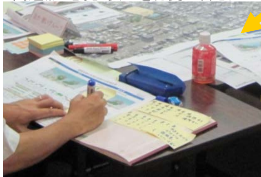
問題点・意見・要望を付箋に書き出し