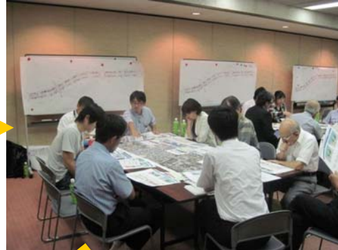
グループ毎にテーマの検討