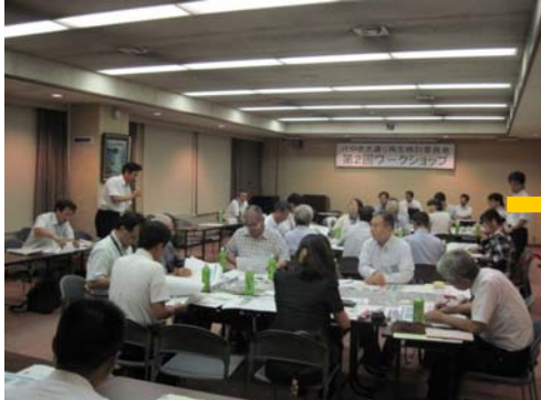
ワークショップ開会、開催趣旨の説明等