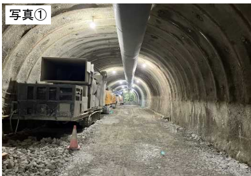
令和6年9月末現在(施工状況)