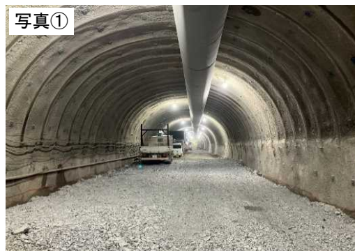
令和6年10月末現在(施工状況)