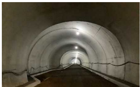
令和6年9月末現在（施工状況）